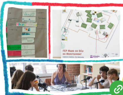
Les relacions que sostenen la COMunitat