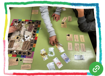
Testimonis contra el racisme