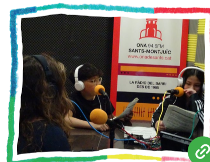
Fem comunitat al barri RELATS SONORS