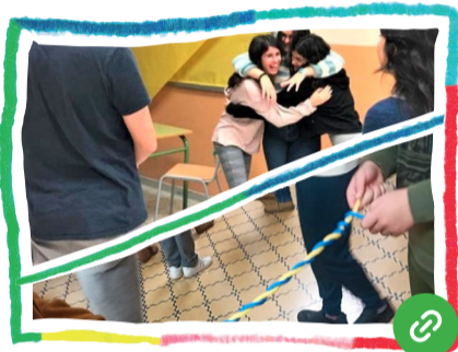
Teatre de les oprimides per transformar les relacions