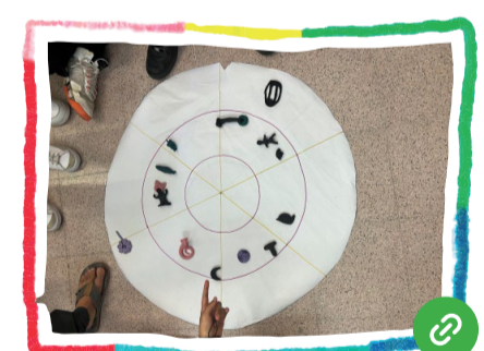
El centre i el barri són espais per transformar