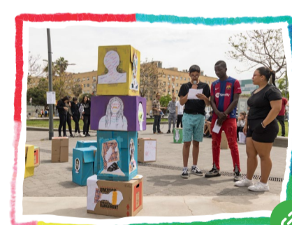
Fem comunitat al barri ARTIVISME