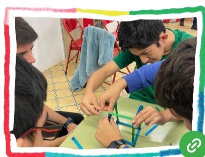
A la pell dels altres (Joc de rol)