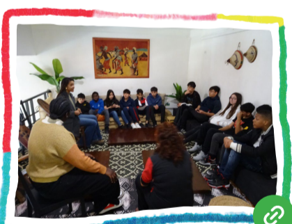
Visitem iniciatives d'ESS i antiracistes