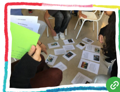
La història única crea estereotips