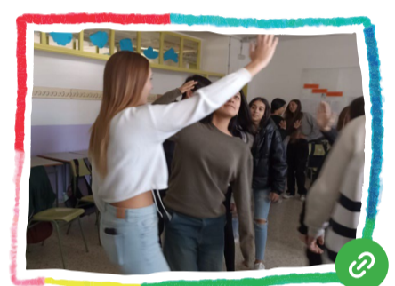
Som éssers interdependents (ètica de la cura)