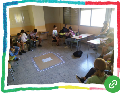
De-unitats a COM-unitats