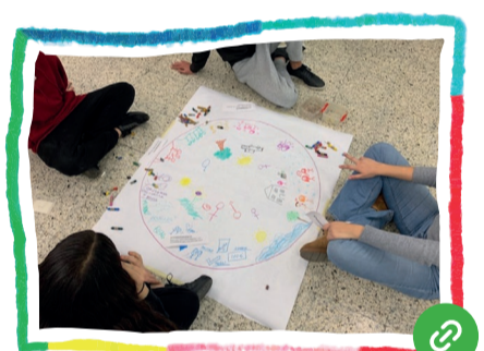
Imaginem Comunitats i territoris sostenibles (expressió artística)