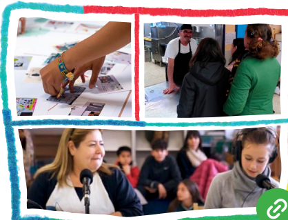
Les relacions que sostenen la COMunitat