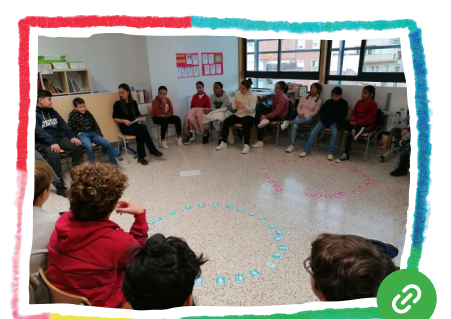
Som éssers interdependents (ètica de la cura)