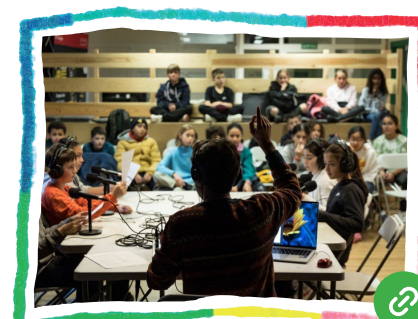
Fem comunitat al barri RELATS SONORS