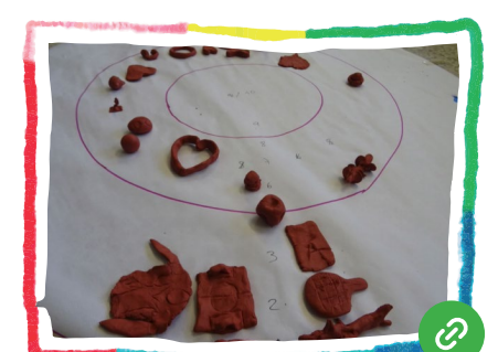
El centre i el barri són espais per transformar