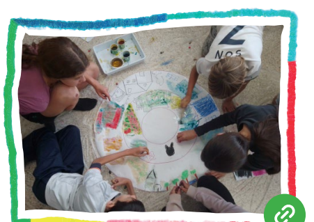
Imaginem Comunitats i territoris sostenibles (expressió artística)