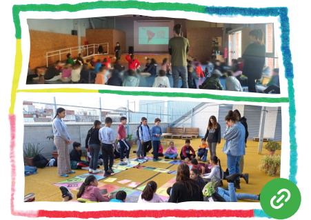
Testimonis contra el racisme