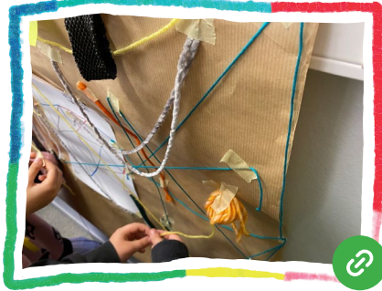
De-unitats a COM-unitats