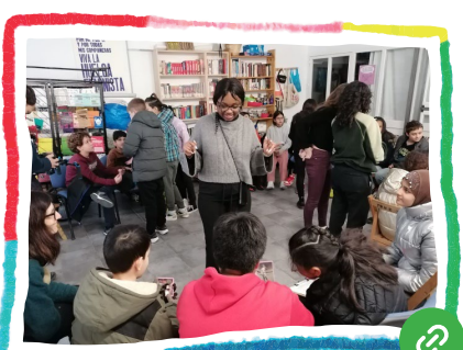
Visitem iniciatives d'ESS i antiracistes