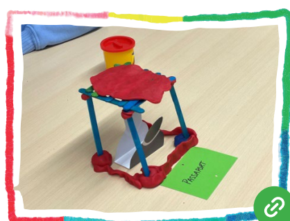
A la pell dels altres (Joc de rol)