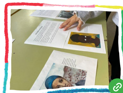
La història única crea estereotips