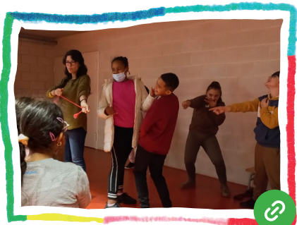
Teatre de les oprimides per transformar les relacions