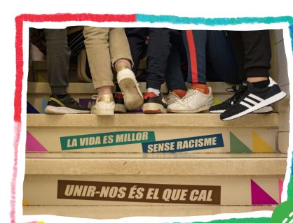
Fem comunitat al barri ARTIVISME